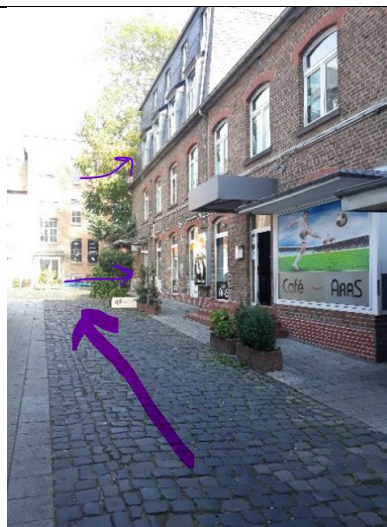
An Café Aras vorbei.