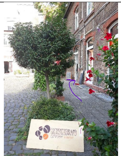
Auf die Schilder mit "Über den Tellerrand" achten.

Gerne anrufen, falls man es nicht findet - Tel: 069 / 872 068 77.